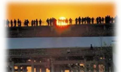
写真) 大阪万博:大屋根リングからの夕日が話題に...多くの来場者が撮影:読売新聞