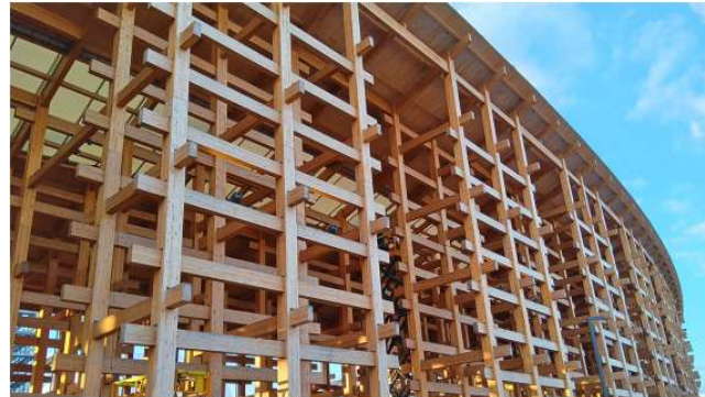
写真) 大屋根リング