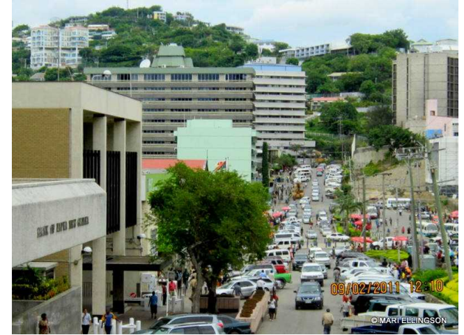
Traffic Congestion at Various Intersections during Peak hours at our capital city, Port Moresby. 首都ポートモレスビーでは、ピーク時間中さまざまな交差点で渋滞。