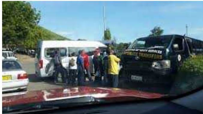
Vehicle accidents at a intersection at Port Moresby