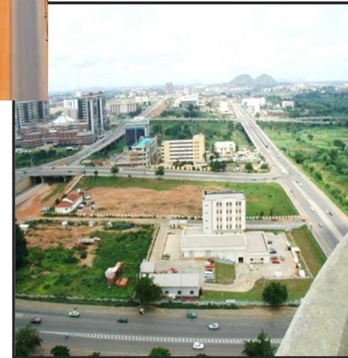
Abuja City Urban Road-network within the Central Business District