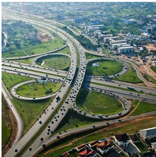
Ring Road 1 / Northern Parkway Interchange referred to as Mabushi Bridge by locals

アブジャシティゲートとナショナルスタジアムの眺め、CBDに面する両側に B6 / B12高速道路がある