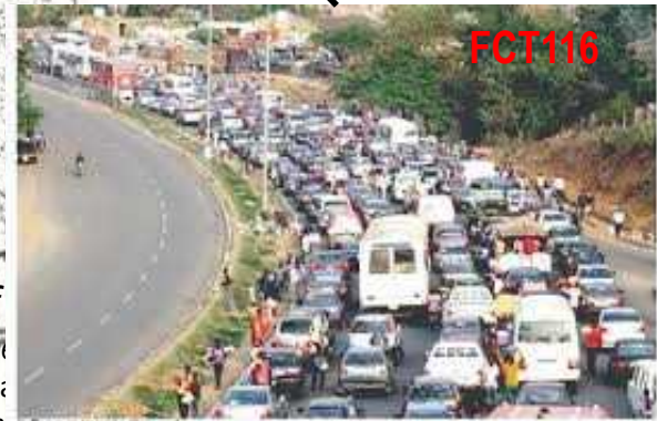
Fig. 4c: Status of Source: ONEX – scanm A02 – Jones B FCT 116 – Sun