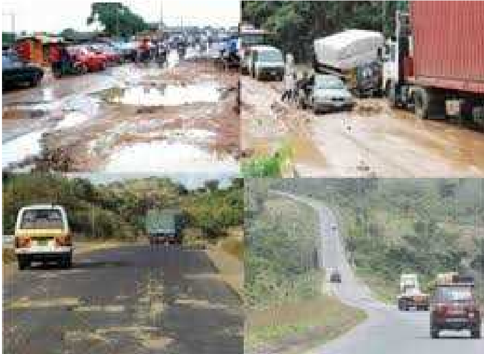
Road Pavement Conditions