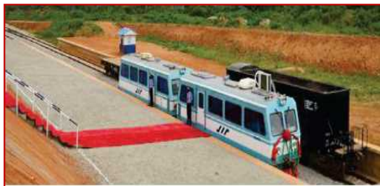
Abuja City - Kaduna Railway Line