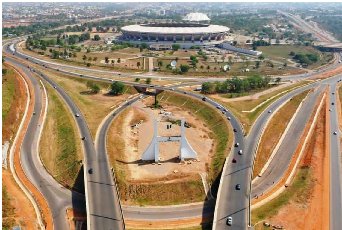
View of Abuja City Gate and the National Stadium with B6 /B12 expressway on both sides facing the CBD

アブジャシティゲートとナショナルスタジアムの眺め、CBDに面する両側に B6 / B12高速道路がある