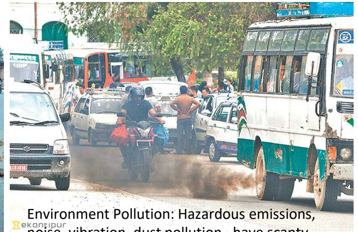
Environment Pollution: Hazardous emissions, noise, vibration, dust pollution, have scanty greenbelts