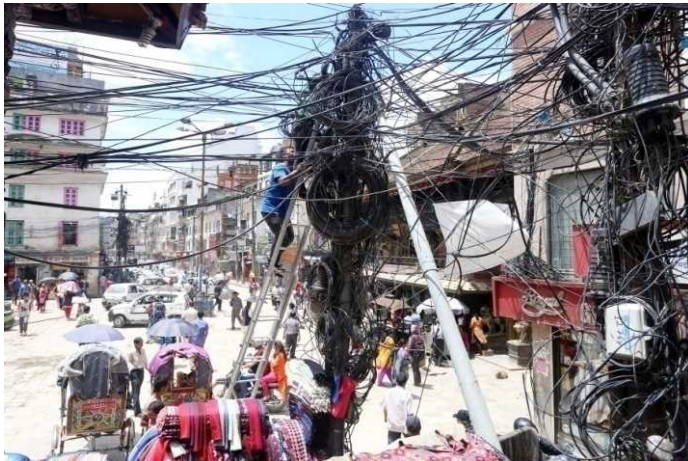
No utility lane for Telecommunication, Electricity, Sewerage, Water Supply services