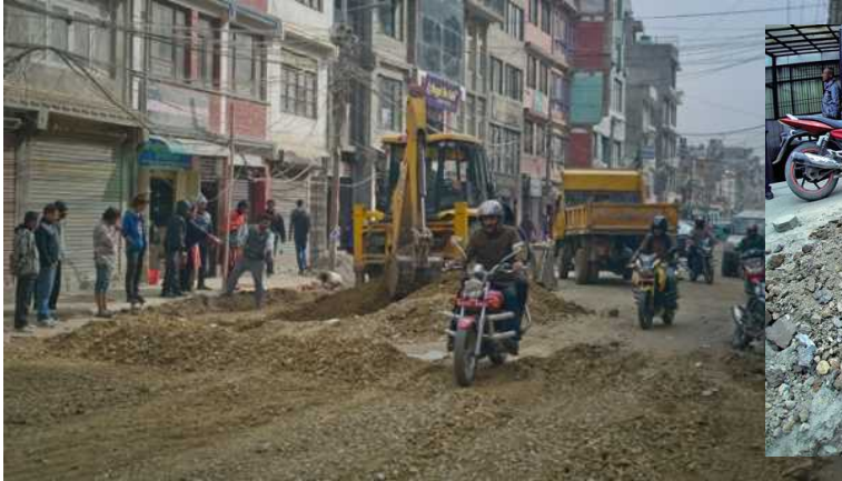
Construction Technology: Nonscientific and slow