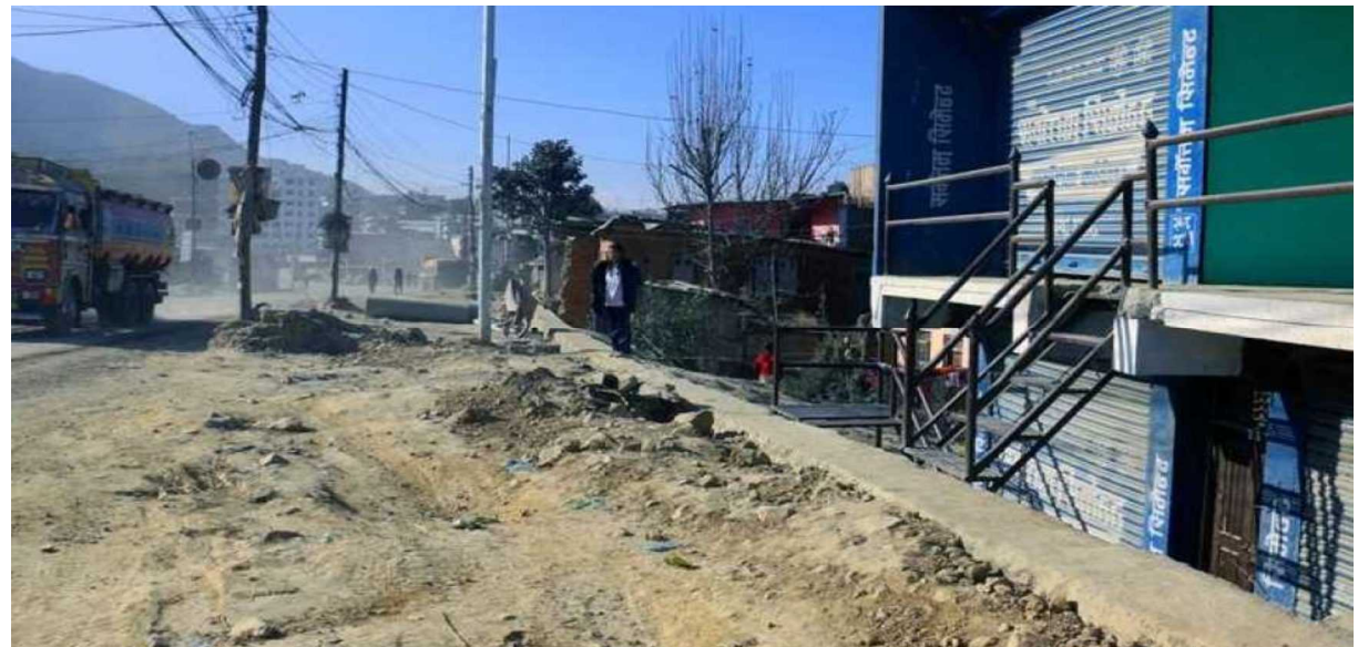
Land acquisition - Disturbing urban road construction

Others: Inadequate capacity of contractors and consultant