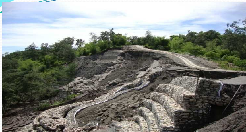
This caused by the rain Year 2011 Accident in Distrik Covalima

これは、Distrik Covalimaの2011年の雨による雨によるものです。