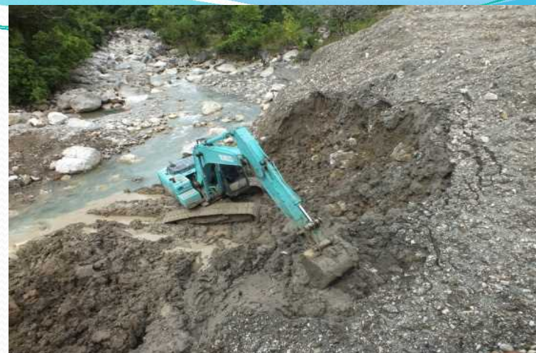
Natural Disaster Caused by the heavy rain resulted in many soil go down and landslide 大雨による自然災害多くの土壌が崩れ、地すべりが発生した