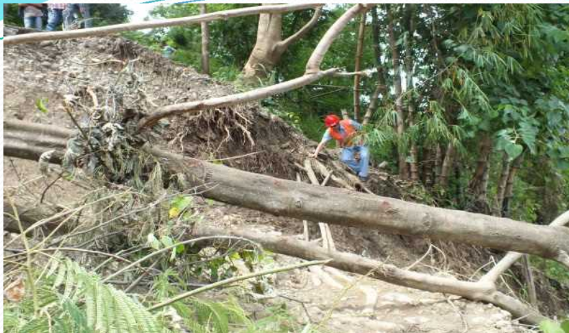
Natural Disaster Caused by the heavy rain resulted in landslide 大雨による自然災害による地すべり