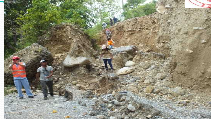
Group work field survey, グループワークフィールド調査、