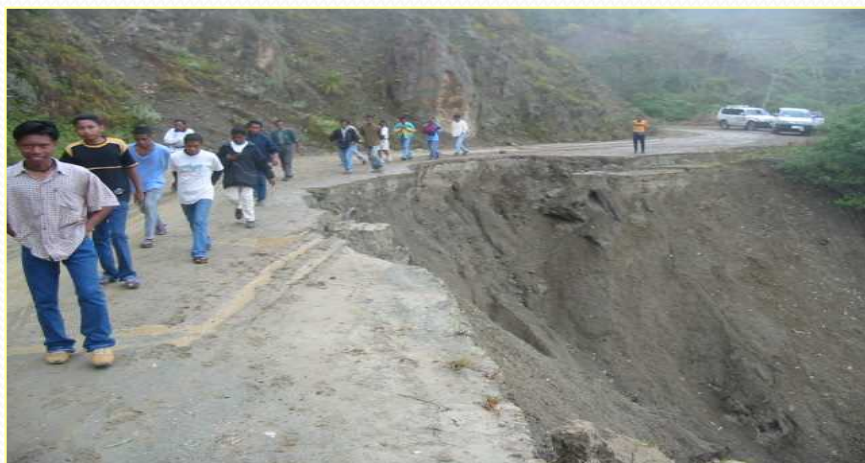
Our organization has take nesssary Year 2010 Accident in Distrik.Manufahi

私の組織はDistrik Bobonaroでこの原因となった2013年の事故が発生しています。