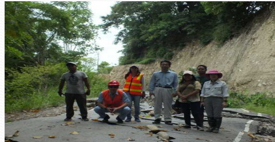
Group work field survey, グループワーク実地調査、