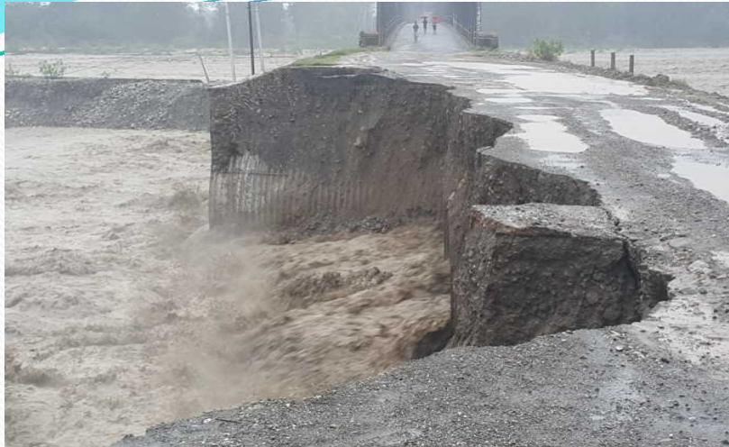
Our organization has take necessary Year 2011 Accident in Distrik Covalima