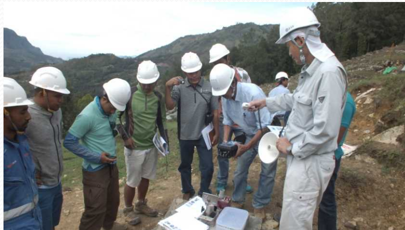
One Staff consultan Ingérosecc from Japan explain use Equipament for tests landslides Year 2017 Acidentent