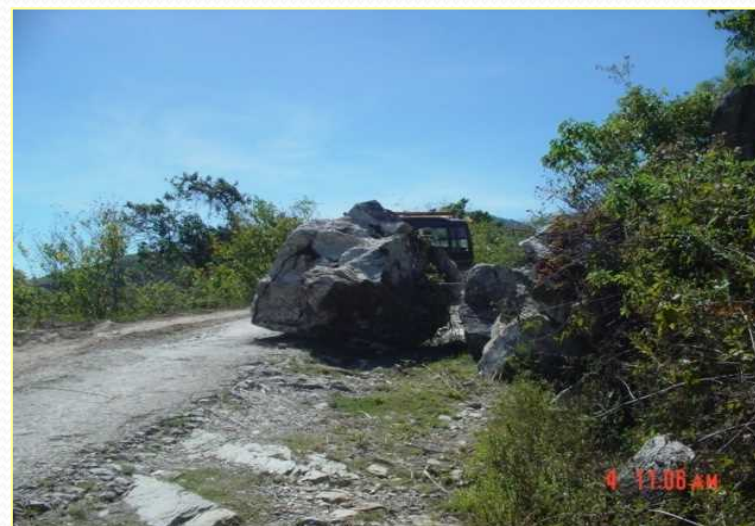
Natural Disaster Caused by the heavy rain resulted in road closure due to rock fall. 大雨による自然災害が原因で、落石による道路閉鎖が発生しました。