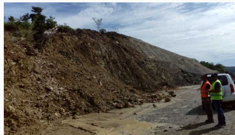
I was involved in caused beacause have season the rains Year 2017 accident in Distrik.Covalima