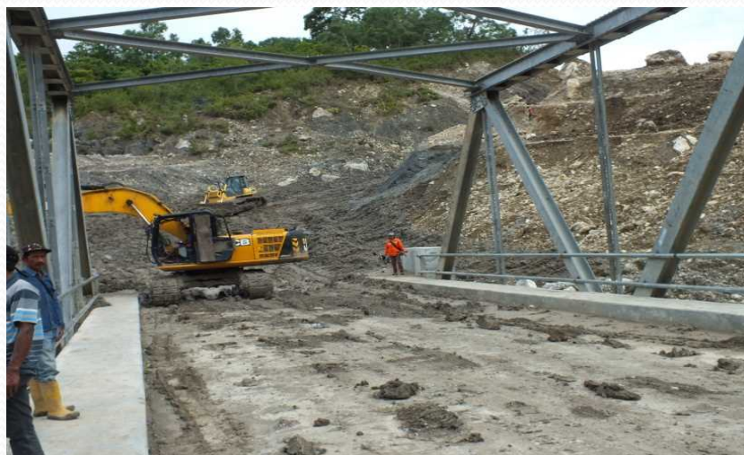
Natural Disaster Caused by the heavy rain resulted in soil going down and damaged the bridge. 自然災害大雨による土砂崩れと橋の損傷。