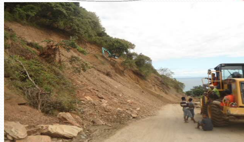
My Organization has atende this caused Year 2013 Accident in Distrik Bobonaro

これは、Distrik Covalimaの2011年の雨による雨によるものです。