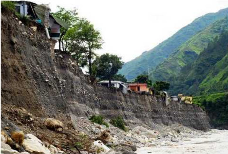
Photo showing erosion of the Mahakali river bank in June 2013, with homes and villages precariously close by.