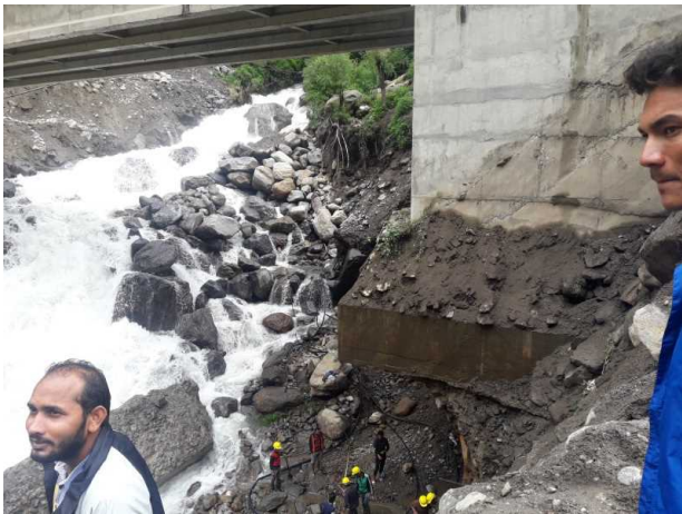
Ghatte Khola Bridge foundation exposed by the flood this year 今年の洪水に見舞われたガッテコラ橋基礎