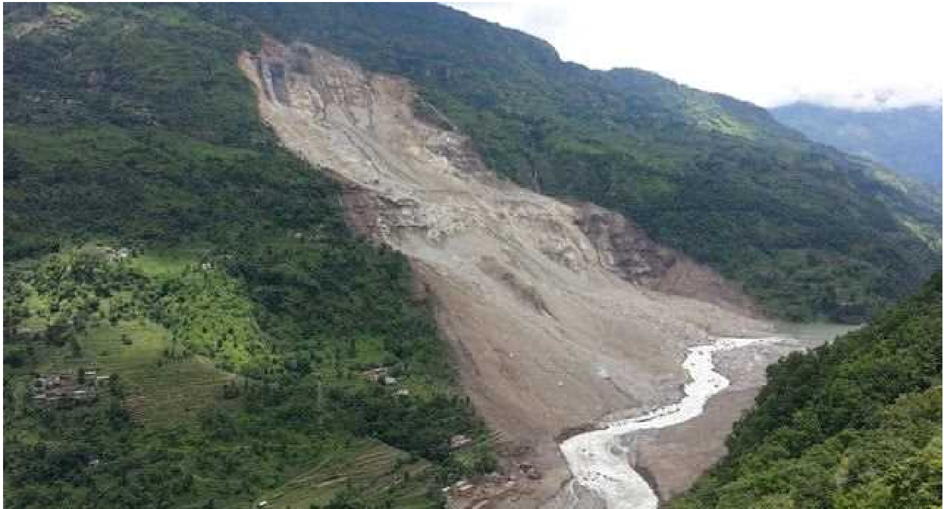
アラニコ道を塞いだ地すべり