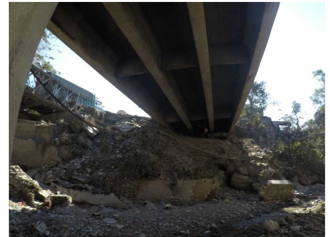
Abutment Protection Works Damaged By Flood in No. 3 Bridge along Mahendra Highway