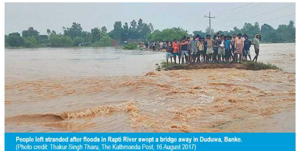
People left stranded after floods in Rapti River swept a bridge away in Duduwa, Banke.

2013年のマハカリ洪水約3000人が避難した Darchula地区/ Far west Nepalのいくつかの役所や学校を含む77の建物が流された