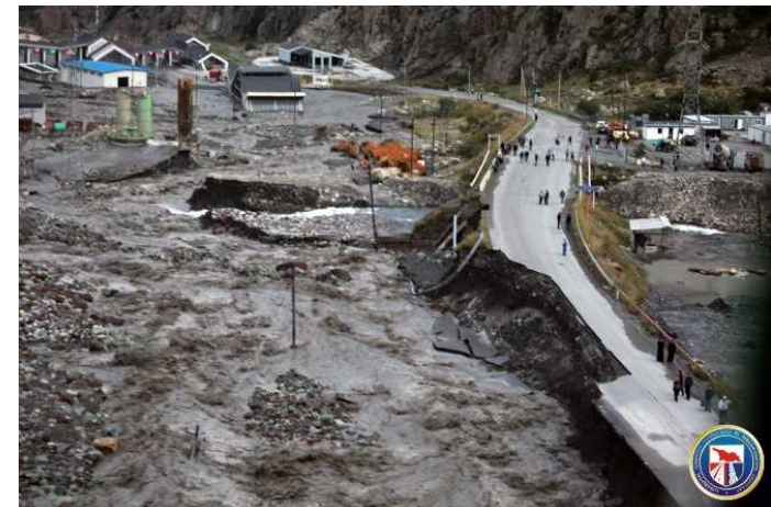
Debris Flow - military road - 2014 year 6 person died 土石流 - 軍事道路 - 2014年 3 6人が死亡しました