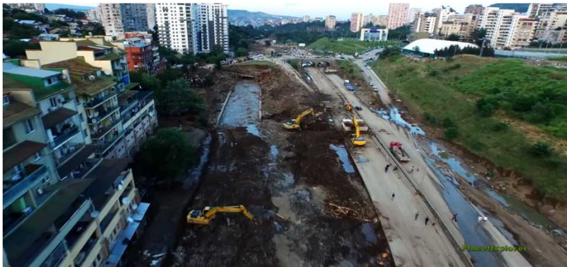
Tbilisi flooding - 2015 year 24 person died トビリシ洪水 - 2015年 24人が死亡しました