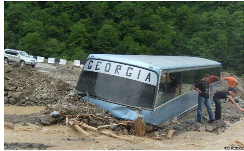
Debris Flow on national highway - 2011 year 6 person died 国道上の土石流 - 2011年 6人が死亡しました